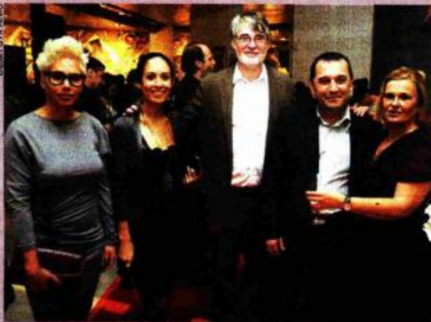
Glumci i redatelj na domjenku nakon premijere

Uz netipične delicije, scenografiju domjenka obilježili su i neobični gigantski, u "žičanu ogradu" umotani cvjetni buketi koje je INK darovao članovima ansambla predstave.